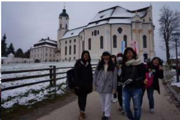
世界遺産の「ヴィース教会」です。