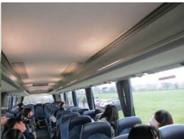
ウィンチカムから出発