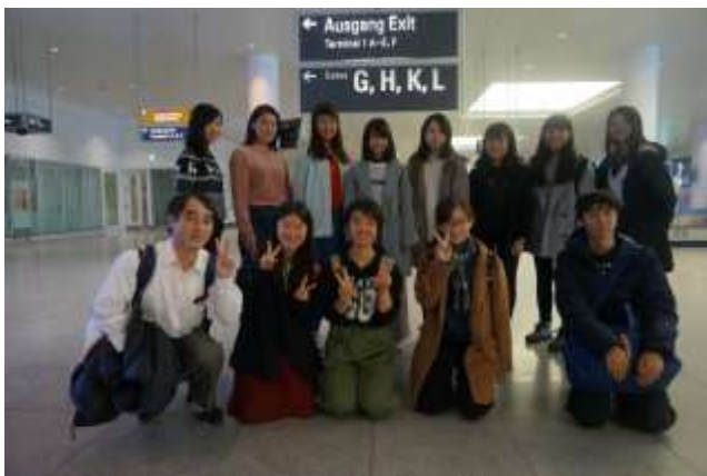
ミュンヘンの空港に着きました！

2016年11月12日（土）羽田空港を出発し、同日夕方にミュンヘン到着。ホテルに泊まりました。