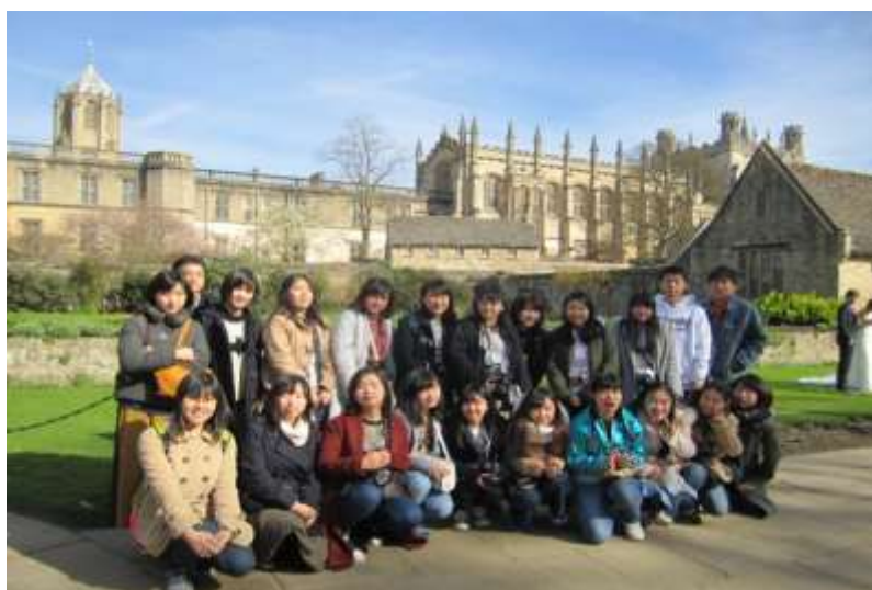
オックスフォード