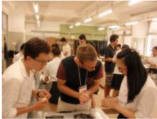
和食作りを教える