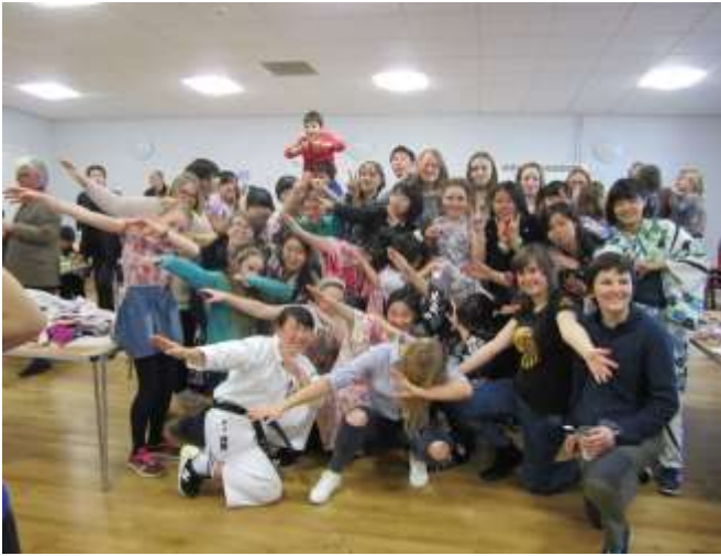
スクールバディやホストファミリーと一緒に