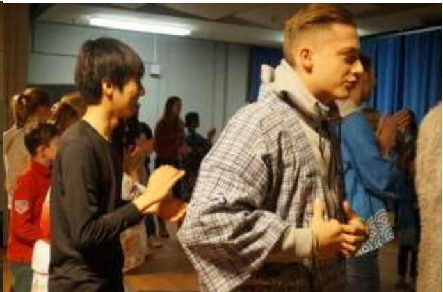
ホスト生徒と一緒に盆踊りを踊りました。