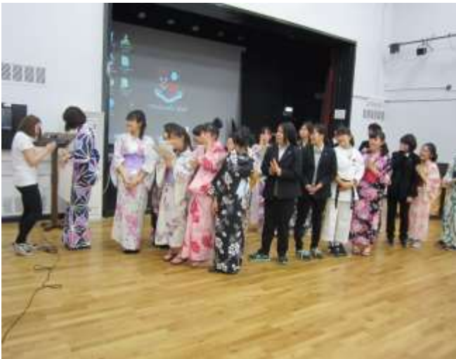
ウィンチカムスクールの生徒挨拶