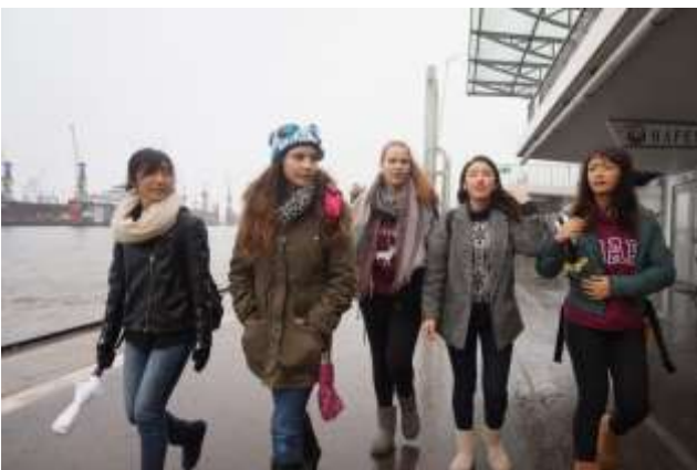
ハンブルク港を散策。

11月16日（水）午前中は授業を受けて、午後からホスト生徒と一緒にハンブルクに出かけました。