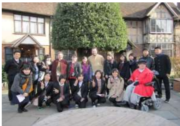
ストラットフォードのシェークスピアの生家の前

22日(水曜日) ：訪問3日目。午前中は授業に参加し、昼食後はグロスターシャー大学を訪問しました。