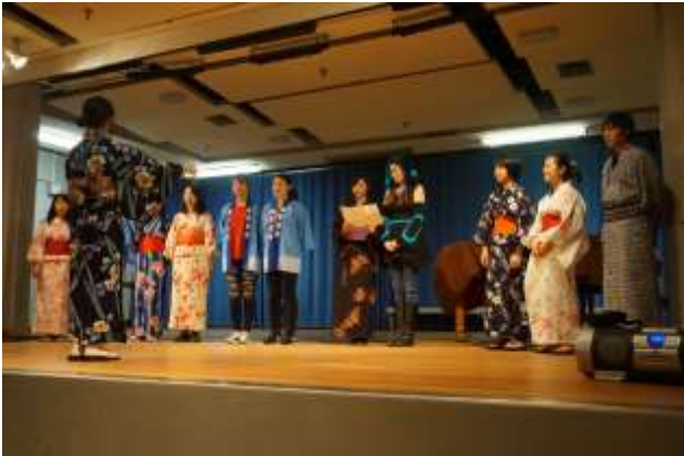
「野ばら」をドイツ語で歌いました。