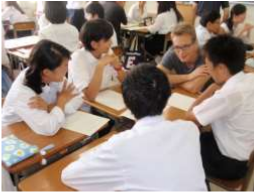
少人数でグループディスカッション

今年もフランスから大学生10人が来校しました。英語の授業で交流をし、お昼に国際交流委員を和食を作り、一緒に食べた後、2時からは華道部と剣道部に参加しました。