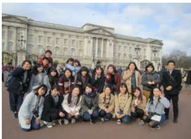
バッキンガム宮殿の前

26日(日曜日) ：9時にホテルを出発し、午前中は大英博物館とバスの中からロンドン市内観光しました。4時頃にはヒースロー空港に到着し、7時の飛行機で帰国の途に就きました。