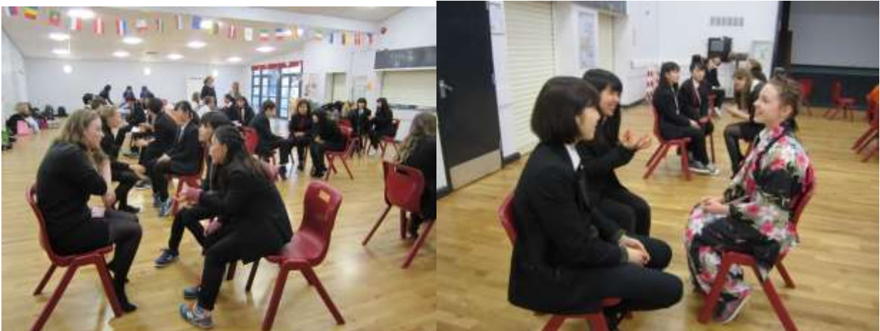
スクールバディとのディスカッション

24日(金曜日): 訪問5日目。午前中は授業、午後はさよならパーティを行いました。