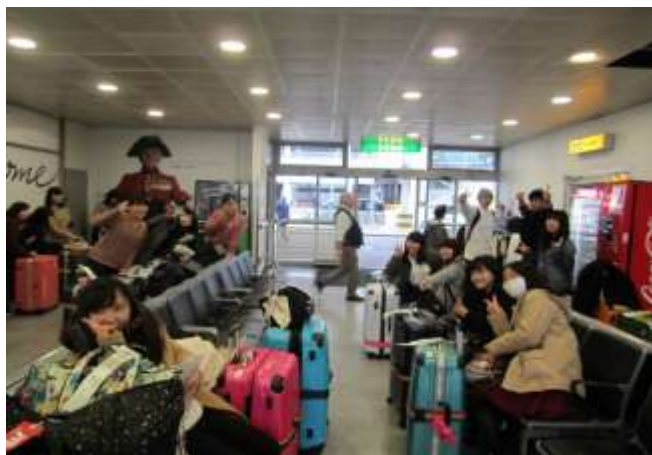
ヒースロー空港に到着

18日（土曜日） ：羽田空港を出発し、12時間後にロンドン・ヒースロー空港に到着しました。専用バスでウィンチカムに移動し、到着後、ホストファミリーとの対面式が行われました。