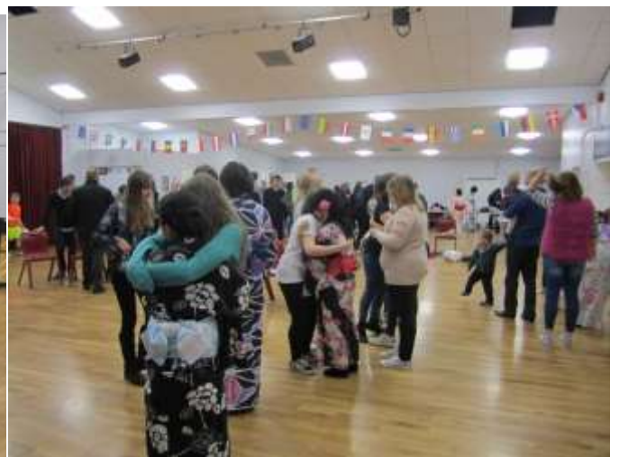
パーティー終了後

合唱、ウィンチカムスクールの生徒挨拶、本校生徒挨拶で、さよならパーティーは終了しました。