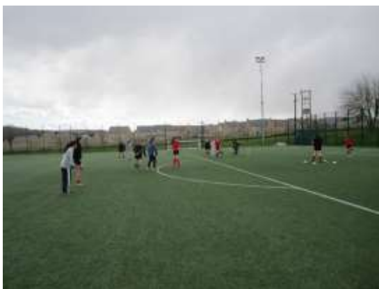
体育(ラウンダー)の授業

21日(火曜日) ：訪問2日目。午前中は授業で、昼食後ストラットフォードまでバスハイクに行きました。