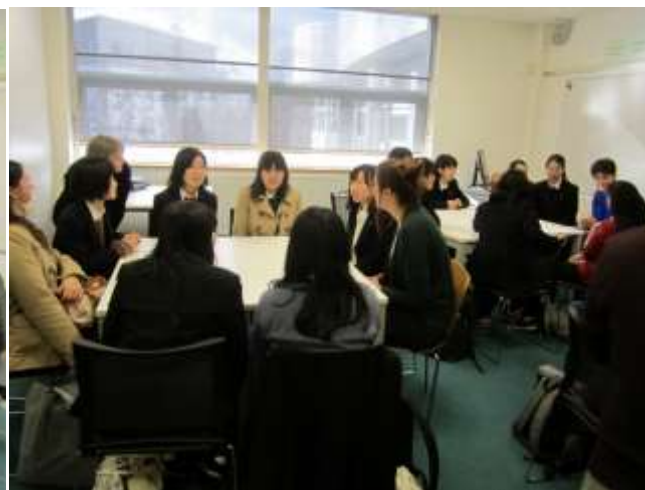
グロスターシャー大学・ケンブリッジ大学の学生とのディスカッション