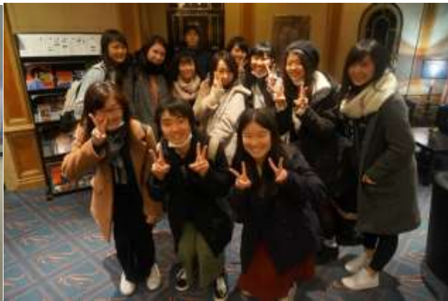
「リージェントホテル」です。