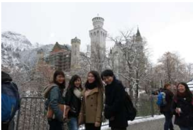
シンデレラ城のモデルになった ノイシュヴァンシュタイン城です。