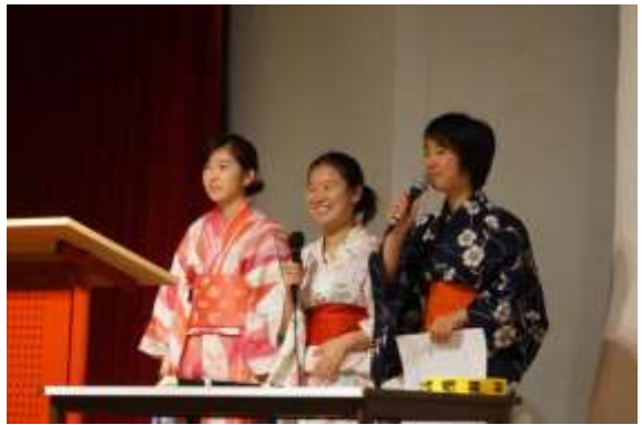
日本の歌謡曲について