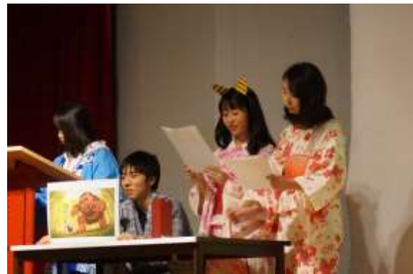
日本昔話について