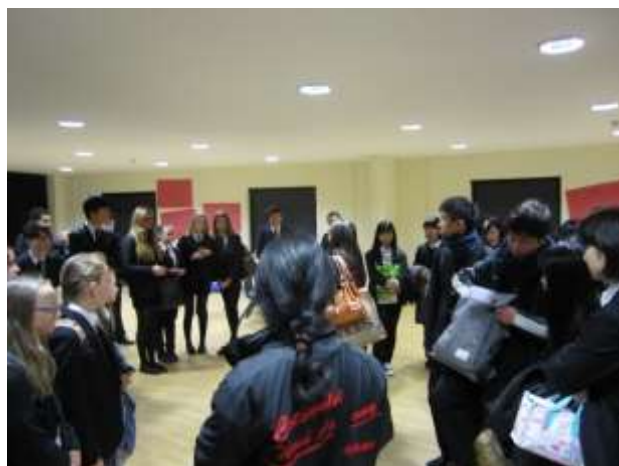
バディと一緒に授業を受ける直前

21日(火曜日) ：訪問2日目。午前中は授業で、昼食後ストラットフォードまでバスハイクに行きました。