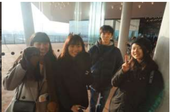
エルプフィルハーモニーの展望台です。