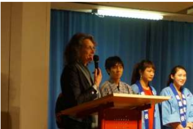
校長先生から言葉をもらいました。