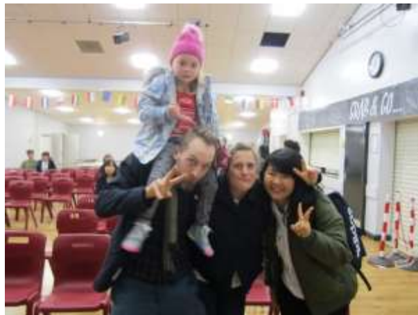
ホストファミリーとの対面