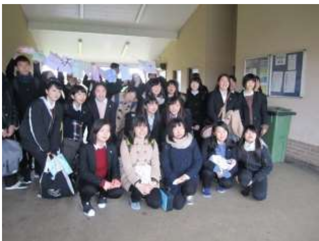
朝登校直後、現地校の生徒と一緒に 手に持った紙には、日本語で「ウィンチカムにようこそ」

20日(月曜日) ：訪問1日目。スクールバディと対面し一緒にウィンチカムスクールの授業に参加しました。